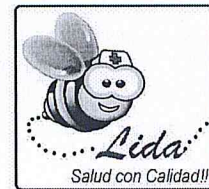
TABLA DE CONTENIDO ASPECTOS GENERALES